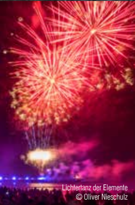
Lichtertanz der Elemente