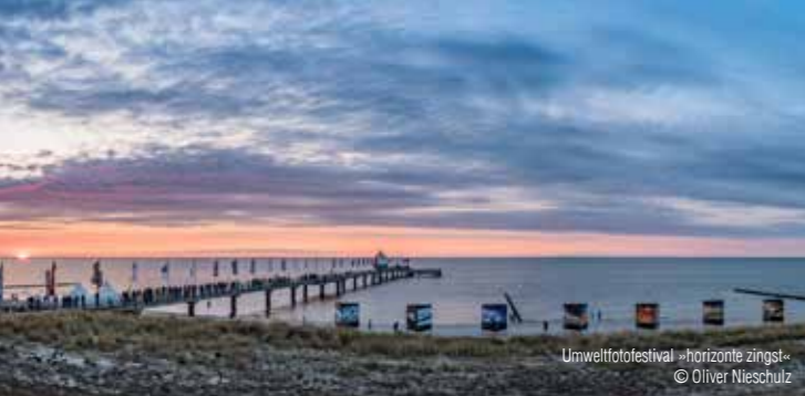
Umweltfestival »horizonte zingst«