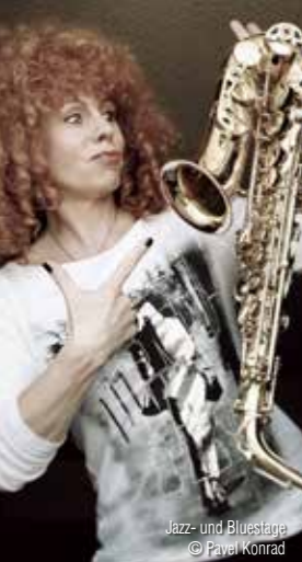
Jazz- und Bluestage