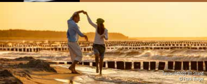
Tanzworkshops am Strand